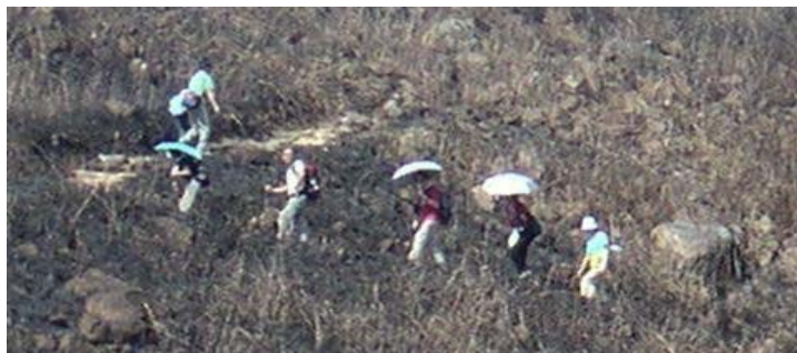
香港奇景——打傘行山

人，真是香港行山一大奇觀，也是一大錯誤示範，太危險了。雖然如此，一隊行山人群走在山徑及綫線上卻也構成一幅特殊景觀。沿途有一大片焦黑的山坡地，很明顯是剛受山火蹂躪過的遺跡。不禁令我想起八仙嶺的風雨亭，及那場奪走師生五命的無情山火。當我們繞過二東山往大東山路上，可以看見十多間石屋沿著山徑散佈於山坡上，給這美麗的山景增添一層神秘的色彩。據說這些石屋是以前修道人潛心修道的地方。鳳凰徑在2600英尺左右繞過大東山後，陡直下落到伯公坳。雖然我們沒帶睡袋及帳棚，背著三天的口糧、衣物、寢具，在艷陽下走七英哩半，翻越大東山，爬高2800英尺也夠累人的。記得左伯桃和羊角哀的故事嗎？當我們在伯公坳午